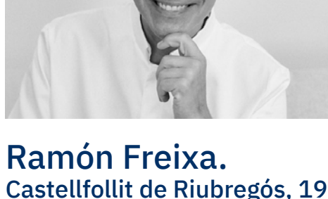
Ramón Freixa. Castellfollit de Riubregós, 1971.

“Trabajo desde la tradición y experimento para crear nuevas recetas que sorprendan y, sobre todo, que gusten”. Ramón no ha cesado de explorar cada territorio en busca del mejor producto, desde el más sencillo hasta el más sofisticado, siempre protagonista en su cocina y que hoy sube a bordo de los trenes.