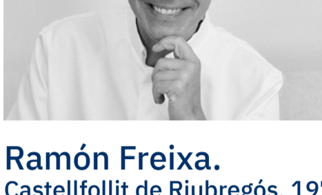
Ramón Freixa. Castellfollit de Riubregós, 1971.

“Trabajo desde la tradición y experimento para crear nuevas recetas que sorprendan y, sobre todo, que gusten”. Ramón no ha cesado de explorar cada territorio en busca del mejor producto, desde el más sencillo hasta el más sofisticado, siempre protagonista en su cocina y que hoy sube a bordo de los trenes.