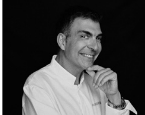
Ramón Freixa. Castellfollit de Riubregós, 1971.

“Treball des de la tradició i experiment per a crear noves receptes que sorprenguin i, sobretot, que agradin”.