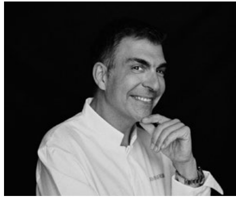
Ramón Freixa. Castellfolit de Riubregós, 1971.

“Trabajo desde la tradición y experimento para crear nuevas recetas que sorprendan y, sobre todo, que gusten”. Ramón no ha cesado de explorar cada territorio en busca del mejor producto, desde el más sencillo hasta el más sofisticado, siempre protagonista en su cocina y que hoy sube a bordo de los trenes.