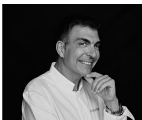
Ramón Freixa. Castellfolit de Riubregós, 1971.

“Trabajo desde la tradición y experimento para crear nuevas recetas que sorprendan y, sobre todo, que gusten”. Ramón no ha cesado de explorar cada territorio en busca del mejor producto, desde el más sencillo hasta el más sofisticado, siempre protagonista en su cocina y que hoy sube a bordo de los trenes.